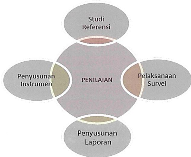
Tabel 1 Model alur penyusunan survei IPK menuju Zona Integritas

Sebelum tim melakukan survei lapangan, dilakukan beberapa tahapan agar instrumen yang dipergunakan dapat diaplikasikan sesuai realitas lapangan. Adapun alur penyusunan tools untuk survei persepsi korupsi ini dapat digambarkan dalam bagan di bawah ini: